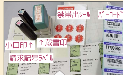
【装備】ラベル位置は定規で測って貼るなど1冊ごとに図書の形状や紙質等を考慮して作業