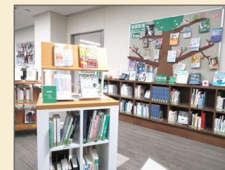
請求記号 ※ 順に配架する！新着図書はしばらくの間、「新着図書コーナー」に並ぶ