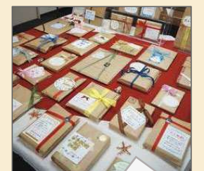
学生モニターさんや職員が図書の紹介ポップを書いて展示することもある (写真は福袋企画)