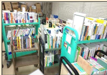
事務室に続々と図書が納品されてブックトラック ※ が大活躍・発注先は確実・早い・安い！を考慮・検品して支払処理