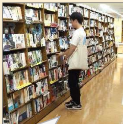
写真は学生モニターさん 書店で選書中！