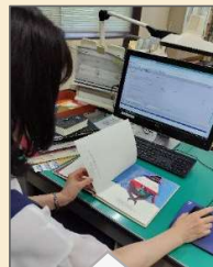
【目録】図書の内容を吟味し、請求記号 ※ を決めて、蔵書として登録！これでOPAC ※ 検索できる！